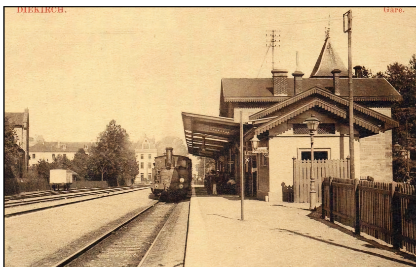
Gare de Diekirch avec une locomotive à vapeur le long du quai et un wagon fermé de la Brasserie de Diekirch sur la voie de desserte gauche. L'aile ouest du Progymnase de Diekirch pointe du nez au fond de l'image. La ligne a1 Ettelbruck - Diekirch (CFL) est desservie à partir de 1862 alors que la voie métrique (Schmalspurbahn) Diekirch - Vianden fonctionne de 1889 à 1948.

... le 8 juin 1871 le grand écrivain français, Victor HUGO (*1802, +1885) mentionne dans son carnet de voyage une arrivée en gare de Diekirch, dont les quais étaient peuplés de femmes qu'il trouva fort séduisantes. Par la suite, il séjournait pendant 4 jours au Grand Hôtel des Ardennes d'Alexis HECK (*1830, +1908) où il occupait la chambre et le salon de la suite N°15. Dans l'ouvrage intitulé « Actes et Paroles 1870-1871-1872 », Victor HUGO, acide, nous livre la raison de son séjour à Diekirch: « Aujourd'hui, 20 août 1871, je suis cité à faire, par-devant le juge d'instruction de Diekirch, délégué par commission rogatoire, la déclaration de l'acte tenté contre moi [à Bruxelles] dans la nuit du 27 mai. Deux mois et vingt-quatre jours se sont écoulés. Je suis en pays étranger. Le gouvernement belge a laissé aux traces matérielles le temps de disparaître, et aux témoins le temps de se disperser et d'oublier. Puis quand il a fait tout ce qu'il a pu pour rendre l'enquête illusoire, il commence l'enquête. Quand la justice belge pense qu'au bout de près de trois mois le fait a eu le temps de s'évanouir judiciairement et est devenu insaisissable, elle se saisit du fait ». (bp, pm, 2010-03-07)