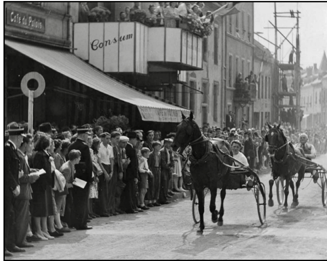
Courses Hippiques internationales de Diekirch en 1949 sur la rue Guillaume