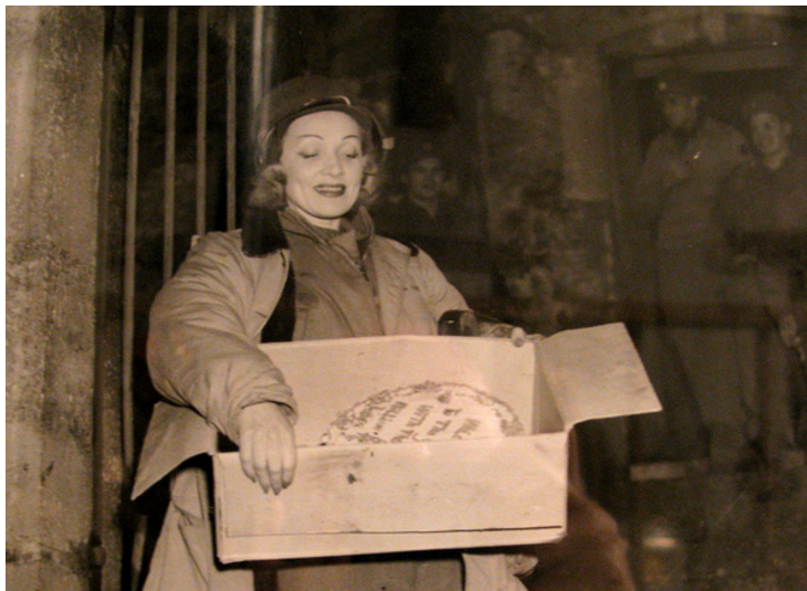
Marlene DIETRICH au service des USO pendant la deuxième Guerre Mondiale.