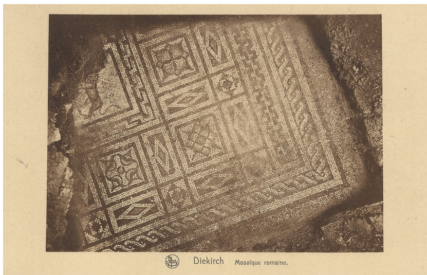
Carte postale montrant la mosaïque au lion partiellement déterrée en 1926. [Photographie: NN; éditeur: NELS; collection: bp (Fundus Marcel WERDEL)]

... à côté des mosaïques romaines trouvées sur l'Esplanade en 1926 (mosaïque au lion), 1950 (mosaïque dite à la tête de méduse) et 1980 (mosaïque de l'apsis), d'autres vestiges romains furent découverts en 1820 (monnaies, Herrenberg), en 1847 (urnes, Herrenberg et médaillon de Caracalla, op der Tonn), en 1848 (colonne romaine, rue du Pont), en 1857 (rue du Curé), en 1917 (urnes, foyer, rue des Remparts), lors des travaux de reconstruction après la deuxième guerre mondiale (rue du Marché, rue de Brabant, Grand-Rue), en 1960 (Vieille Église) et finalement lors des campagnes de fouilles menées par le MNHA en 1992 (Dechensgaart), en 2008 (rue Alexis HECK) et en 2010-2011 (rue Saint Antoine). (bp, cbw, 2010-03-07)