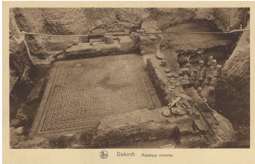
Carte postale montrant, à gauche, la mosaïque au lion complètement détériorée et, à droite, un hypocauste in situ en 1926.