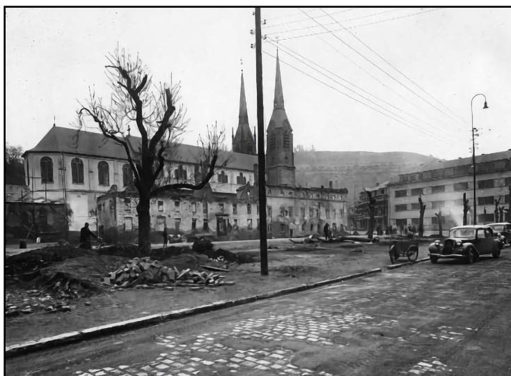
La Place Guillaume (Kluuster) avec l'église Saint-Laurent indemne derrière l'aile sud du Couvent des Récollets en ruines le lendemain de l'offensive de VON RUNDSTEDT en 1945.