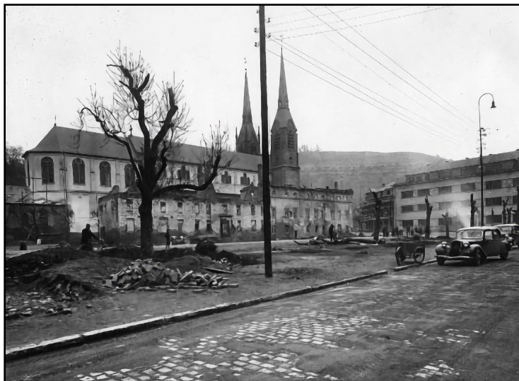
La Place Guillaume (Kluuster) avec l'église Saint-Laurent indemne derrière l'aile sud du Couvent des Récollets en ruines le lendemain de l'offensive de VON RUNDSTEDT en 1945.