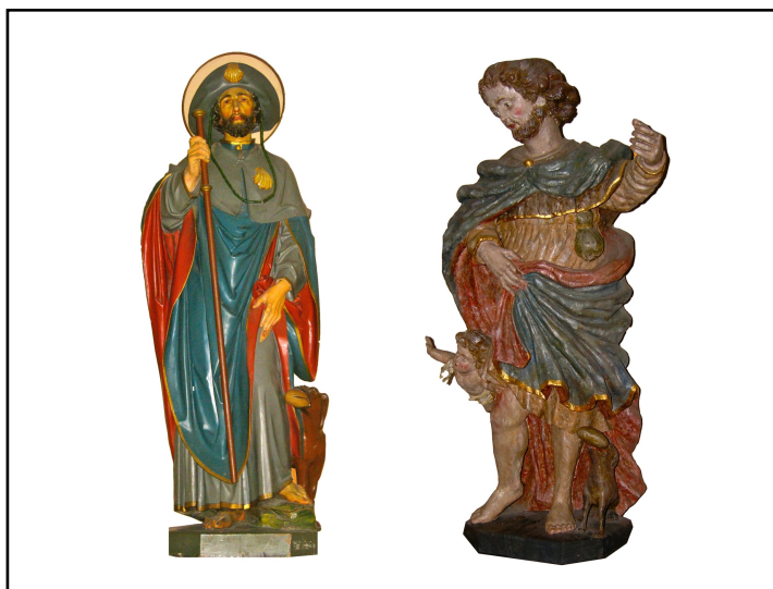
Saint-Roch est invoqué contre les maladies contagieuses des hommes et du bétail, dont la peste et le choléra. À gauche, statue Saint-Roch de l'Eglise décanale et à droite, statue Saint-Roch de la Vieille Eglise

... alors que le choléra sévissait à Diekirch au 19e siècle, la peste s'est acharnée sur les habitants de la région de Diekirch à plusieurs reprises aux 16e (1554, 1579) et 17e (1604, 1613, 1631, 1638, 1668) siècles. La peste est une maladie infectieuse ( Yersinia pestis ) transmise à l'homme par les puces des rats. Elle se développe d'abord par dissémination lymphatique (stade bubonique), puis sanguine (stade septicémique) et enfin respiratoire (stade pneumonique). Les épidémies récidivantes en disent long sur les conditions hygiéniques désastreuses des temps anciens et sur les effets réels des traitements proposés: Cito, longe, tarde, en d'autres mots: Pars vite, va loin et reviens tard. Dès que la « Mort Noire » avait pris possession du bourg, les habitants de Diekirch désertaient leur cité par centaines pour se réfugier dans les forêts des alentours, la Seitert et la Haardt. Ainsi lors de l'épidémie de 1668, les Diekirchois pestilentiels avaient investi le lieu-dit Aaslach à Ingeldorf. (bp, 2010-03-07)