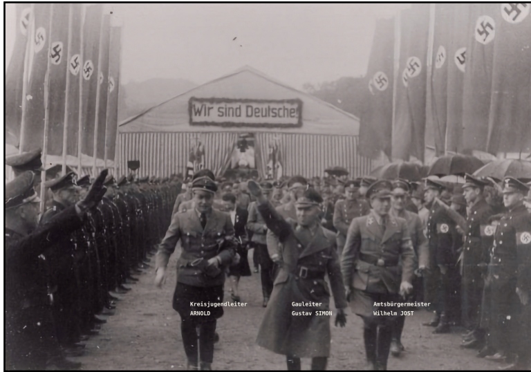
« Großkundgebung am 26. Oktober 1941 im großen Zeltbau auf dem Rennfeld in Diekirch ». Manifestation politique des occupants nazis le 26 octobre 1941 sur le Pärdsrennen à Diekirch. [Photographie: NN_1941; publication: J. HERR in Diekirch, Hier et Aujourd'hui, 1980, p. 207; modification: bp_2023]