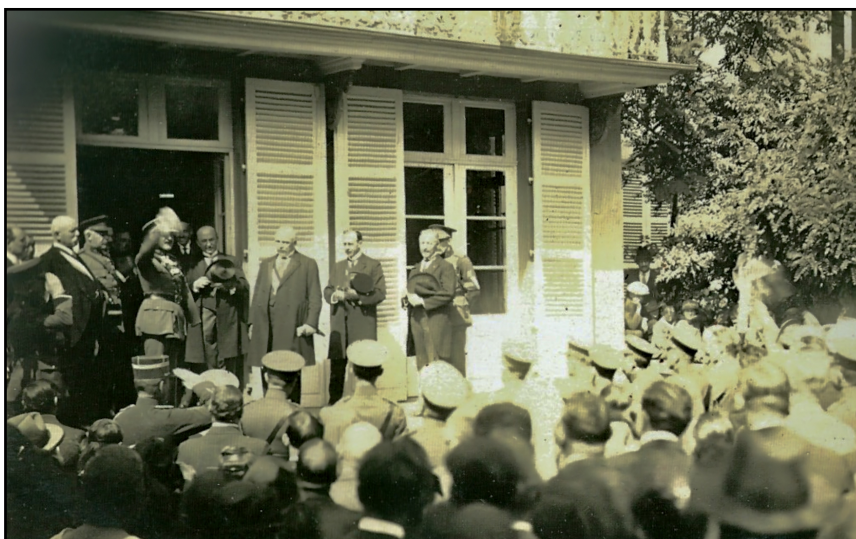
Accueil du général John J. PERSHING, son patronyme alsacien original était PFOERSCHIN, qui salue la foule sur le parvis du Château WIRTGEN.