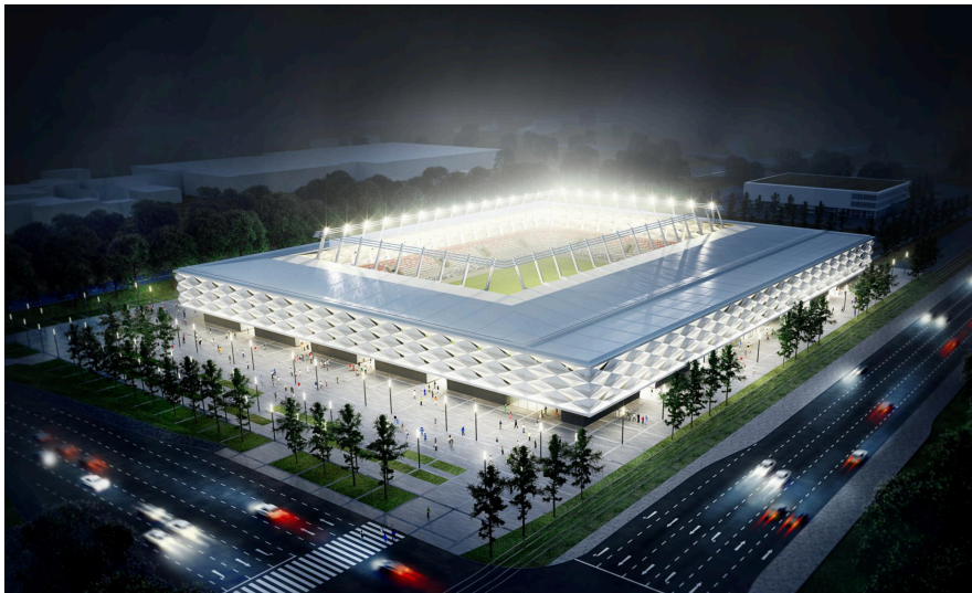
Nouveau stade national de football et de rugby imaginé par gmp – architekten von Gerkan, Marg und Partner et le bureau d'architectes BENG.