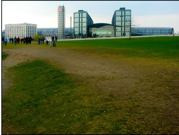
Hauptbahnhof Berlin, gmp – architekten von Gerkan, Marg und Partner.