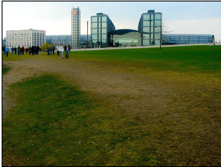
Hauptbahnhof Berlin, gmp – architekten von Gerkan, Marg und Partner.