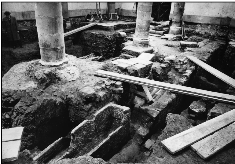
Fouilles archéologiques de la crypte de la Vieille Église Saint-Laurent de Diekirch.

... à la crypte de la Vieille Église Saint-Laurent se trouvent 35 sépultures dont 12 (34 %) sont faites de caissons maçonnés alors que 23 autres (66 %) sont des sarcophages monolithes: Certains des sarcophages monolithes sont constitués d'éléments de récupération (soit réutilisation de sarcophages de périodes antérieures (3), le plus souvent d'origine gallo-romaine; soit aliénation d'éléments architecturaux divers (4) tels canalisations gallo-romaines, demi-colonne ou simple dalle). Les autres sarcophages monolithes sont classés suivant leurs caractéristiques pétrographiques en sarcophages en grès (13) et sarcophages en calcaire clair (3). Alors que les sarcophages en grès peuvent avoir une origine locale ou régionale, les sarcophages en calcaire clair proviennent de carrières du département de la Meuse en France. Cette pierre calcaire est extraite à Savonnières-en-Perthois et à Brauvilliers, deux localités situées à une vingtaine de kilomètres de Bar-le-Duc. A noter que Laure Anne FINOULST qui a mené l'enquête pétrographique des sarcophages monolithes de la crypte de Diekirch en 2009-2010 arrive à en conclure que les sépultures étudiées dateraient en majeure partie d'une période s'étendant du VIIe au IXe siècle, alors que les matériaux utilisés peuvent être bien antérieurs à cette période du fait du remploi homo- ou hétérogène largement répandu dans les pratiques funéraires du haut Moyen-Âge. (bp, cw, 2013-05-24)