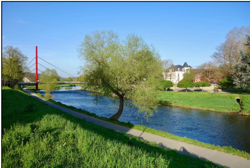
L'élégant pont piéton haubané, dénommé Ficellsbréck, remplace l'ancien pont ferroviaire. La Päerdskaul n'existe plus.