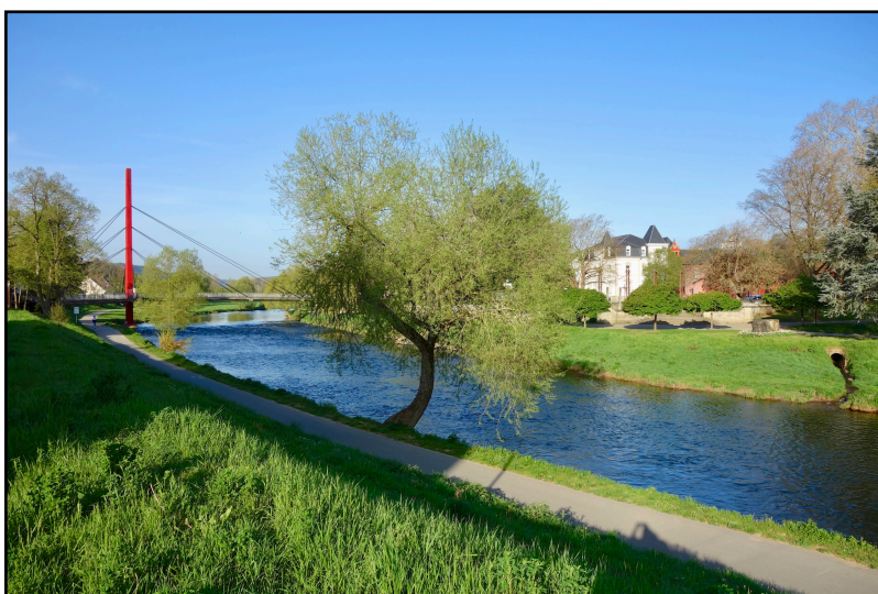
L'élégant pont piéton haubané, dénommé Ficellsbréck, remplace l'ancien pont ferroviaire. La Päerdskaul n'existe plus.