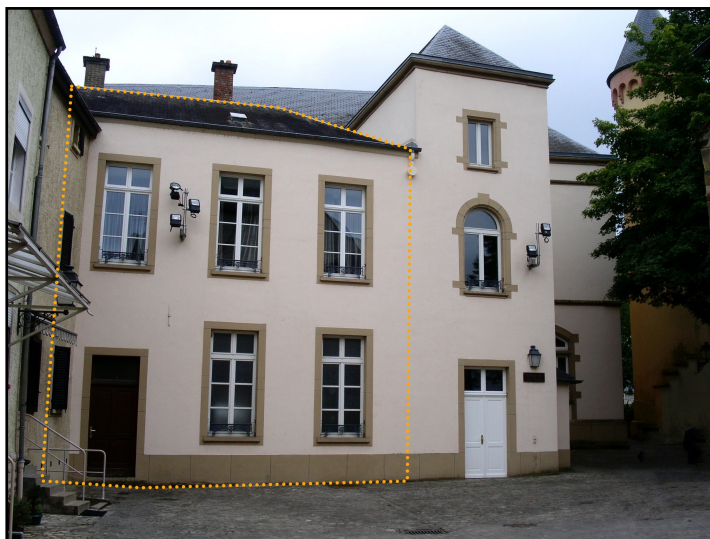
Façade ouest de l'arrière de l'annexe du Château WIRTGEN, située entre la Porte Saint-Nicolas et la Vielle Église Saint-Laurent, dont le gabarit amputé de la tour à droite (surface délimitée par ligne pointillée jaune) correspond parfaitement à la façade du bâtiment scolaire dont Pierre Joseph VANDERAIKEN (*1822, +1866) a dressé le plan en 1844. [Photographie: bp_2005; graphique: bp_2023]