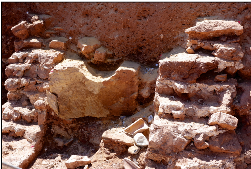
En haut à gauche sur le plan des fouilles de 2013 – 2014: Rigole ou aqueduc taillé dans un bloc de pierre (au centre) au pied du mur septentrional de la villa romaine (à gauche) et du mur de protection et de stabilisation du talus du Härebiërg (à droite).