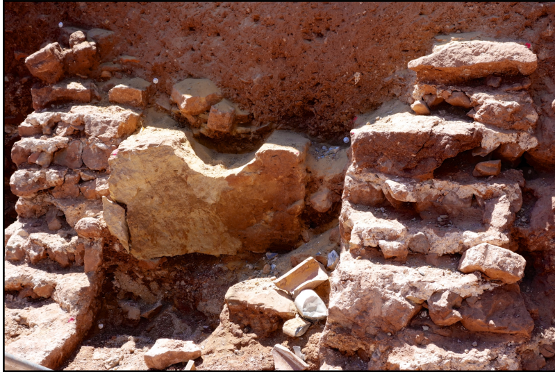
En haut à gauche sur le plan des fouilles de 2013 - 2014: Rigole ou aqueduc taillé dans un bloc de pierre (au centre) au pied du mur septentrional de la villa romaine (à gauche) et du mur de protection et de stabilisation du talus du Härebiërg (à droite).