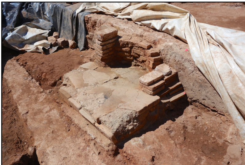
En bas à droite sur le plan des fouilles de 2013 - 2014: Au centre, le four adossé au mur septentrional recouvert à sa face cachée de peintures géométriques polychromes. En bas à gauche: le mur délimitant par l'arrière la bassine énigmatique partiellement vidée.