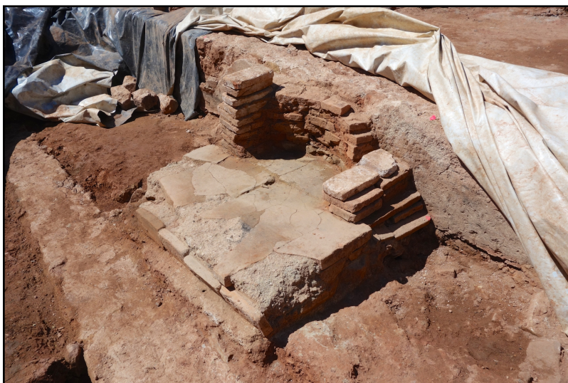
En bas à droite sur le plan des fouilles de 2013 – 2014: Au centre, le four adossé au mur septentrional recouvert à sa face cachée de peintures géométriques polychromes. En bas à gauche: le mur délimitant par l'arrière la bassine énigmatique partiellement vidée.