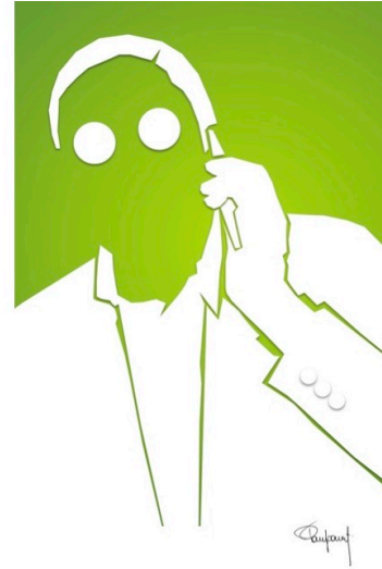
Xavier BETTEL, Etienne SCHNEIDER et François BAUSCH: Les figures de proue des trois partis participant au gouvernement formé en 2013. [Graphique: bp_2013]