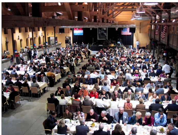
Thanksgiving Dinner (27 novembre 2004) en les salons de la AI Seeërei en commémoration du 60e Anniversaire des deux Libérations de Diekirch.