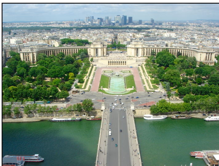
Vue de la Tour EIFFEL en direction du Quartier de la Défense avec (au milieu à droite) le Palais de CHAILLOT qui accueillait l'OTAN de 1950 à 1958, < version annotée >.