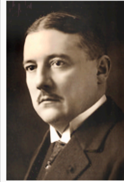
Marcel NOPPENY (*1877, +1966)

Poutty STEIN, Paul PEMMERS et Marcel NOPPENY: Trois figures littéraires contemporaines dont les physionomies sont à l'image des domaines et styles d'écriture particuliers qui les caractérisent un chacun.