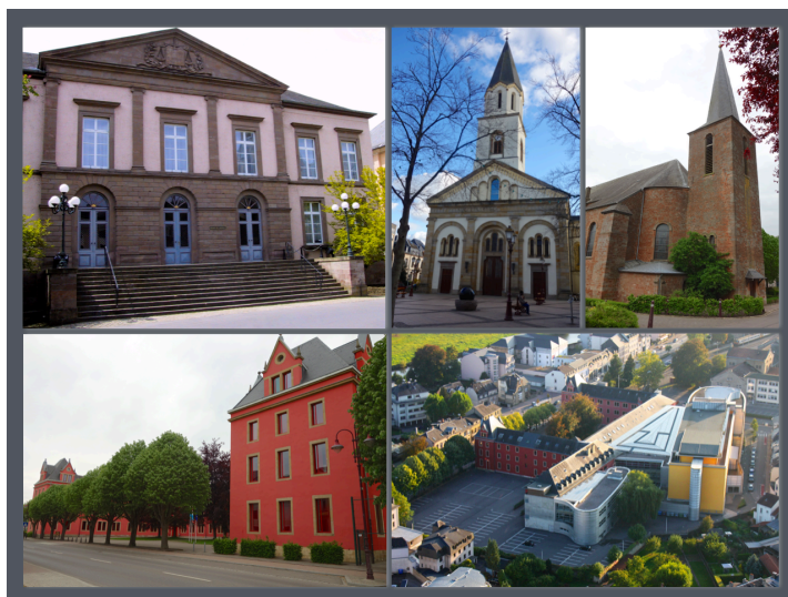
Les ouvrages de Louis Cécile DAGOIS: (en haut, de gauche à droite) 1) Le Palais de Justice ou tribunal d'arrondissement sur la place Guillaume ou Kluuster, 2) l'église paroissiale d'Ettelbrück, 3) l'église de Mertzig, (en bas, de gauche à droite) 4) l'actuel Lycée classique de Diekirch, ancienne caserne de l'avenue de la Gare et 5) le quartier du Lycée classique de Diekirch compris entre l'avenue de la Gare, la rue de la Brasserie et la rue du Gymnase.