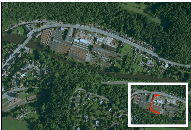
Vue aérienne de l'ancienne usine Imperia à Nessonvaux près de Liège avec piste d'essai aménagée sur le toit de l'usine. En cartouche, le segment subsistant de la piste d'essai en rouge.