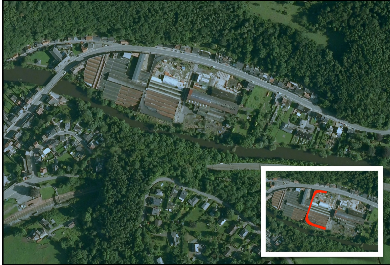
Vue aérienne de l'ancienne usine Imperia à Nessonvaux près de Liège avec piste d'essai aménagée sur le toit de l'usine. En cartouche, le segment subsistant de la piste d'essai en rouge.