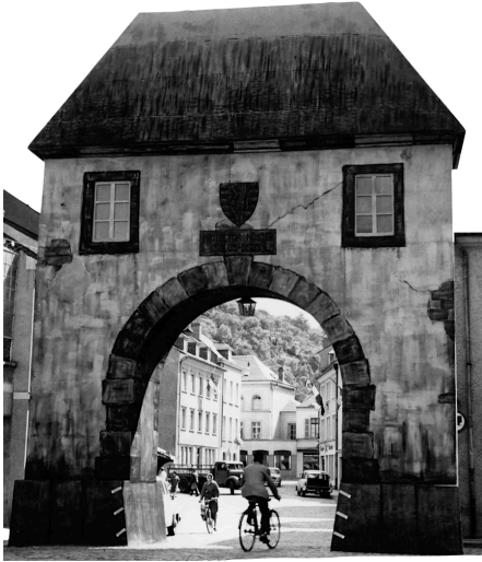
Ewisch Paart, Porte de Liège ou Porte Saint-Antoine à l'entrée de la rue Saint-Antoine, « reconstruite » à l'occasion des festivités du 700e Anniversaire de l'Affranchissement de la Ville de Diekirch en 1960.