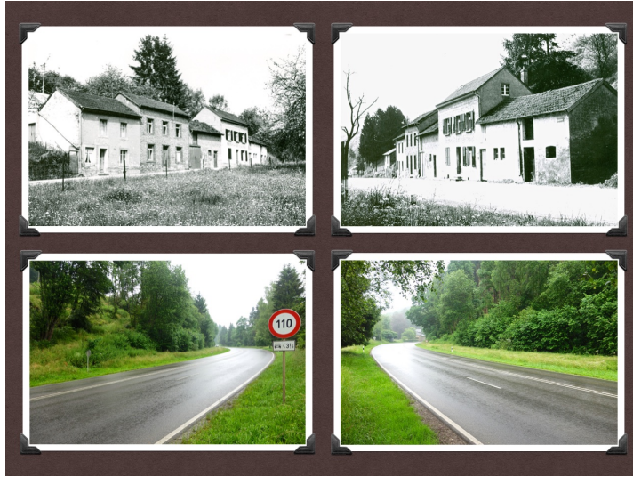
Vues centrifuges (à gauche) et centripètes (à droite) sur le hameau Dräibraken à la sortie de Diekirch, avant (en haut) et après (en bas) démolition des immeubles dans les années soixante. Sur les clichés centripètes (à droite) l'ancienne ferme ZEYEN, l'actuel Foyer Bamerdall, apparaît au bout de la chaussée.