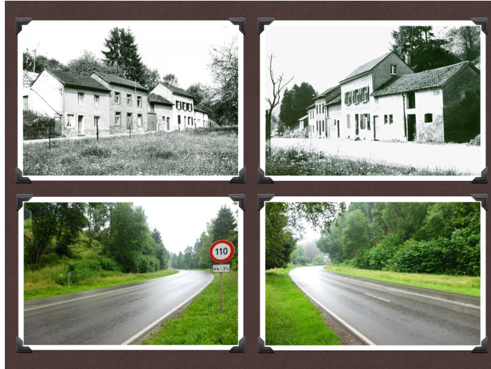
Vues centrifuges (à gauche) et centripètes (à droite) sur le hameau Dräibraken à la sortie de Diekirch, avant (en haut) et après (en bas) démolition des immeubles dans les années soixante. Sur les clichés centripètes (à droite) l'ancienne ferme ZEYEN, l'actuel Foyer Bamerdall, apparaît au bout de la chaussée.