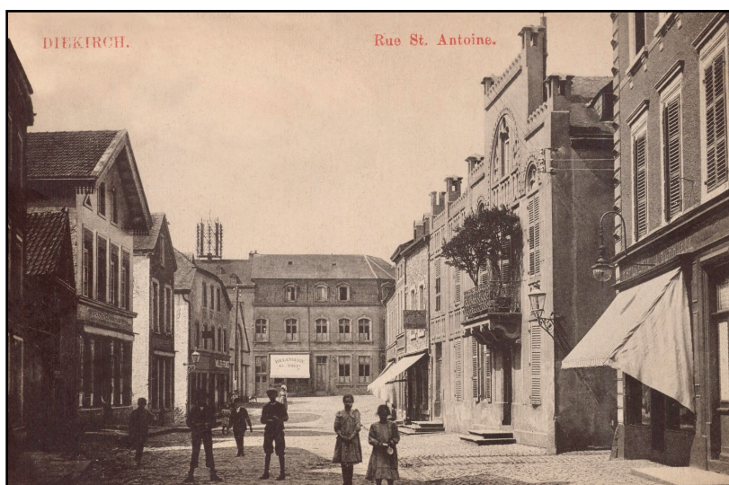
A l'avant-plan, la rue Saint-Antoine et au fond, au centre la Boulangerie Ch. THEIS, actuellement Banque et Caisse d'Épargne de l'État. A droite, la maison d'édition Justin SCHROELL