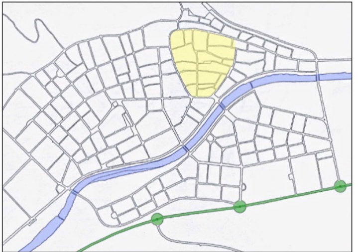
En haut, Masterplan pour la Ville de Diekirch par Léon KRIER (1984). En bas, réseau routier existant en 1984 (à gauche) et tel que projeté par le Masterplan pour la Ville de Diekirch (à droite). Le noyau de la Vieille Ville est en jaune, la Sûre est en bleu et la voie de déstagement du trafic de transition par une tangente sud est en vert.