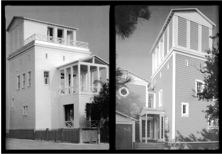
« KRIER-WOLFF House » au 84, Tupelo Street à Seaside en Floride aux USA. A gauche, version originale de 1985 peinte en blanc-magnolia et à droite, version agrandie de 2003 peinte en rouge-brique.