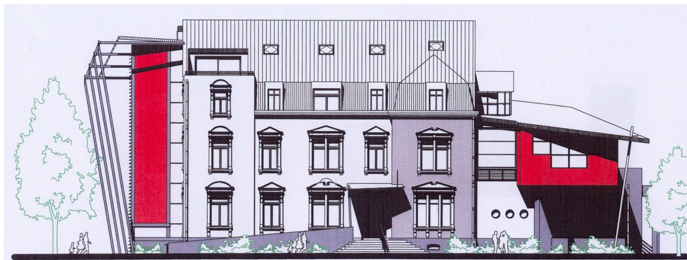
Projet de transformation et d'agrandissement de l'Hôtel de Ville de Diekirch (Villa RICHARD) proposé en 2005 par l'architecte Marc SPEICHER. [Ville de Diekirch; plan: Architecte Marc SPEICHER_2005].