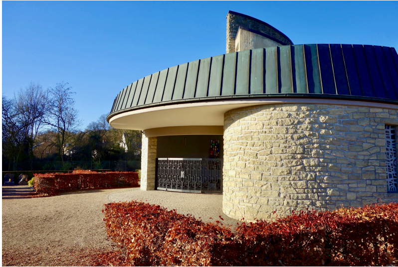
La chapelle ardente en colimaçon du nouveau cimetière de Diekirch au lieu-dit iwwer der Flossbaach imaginée par le bureau d'architecture JEGEN & GAUL, prend la succession de la Chapelle VANNERUS de l'ancien cimetière.