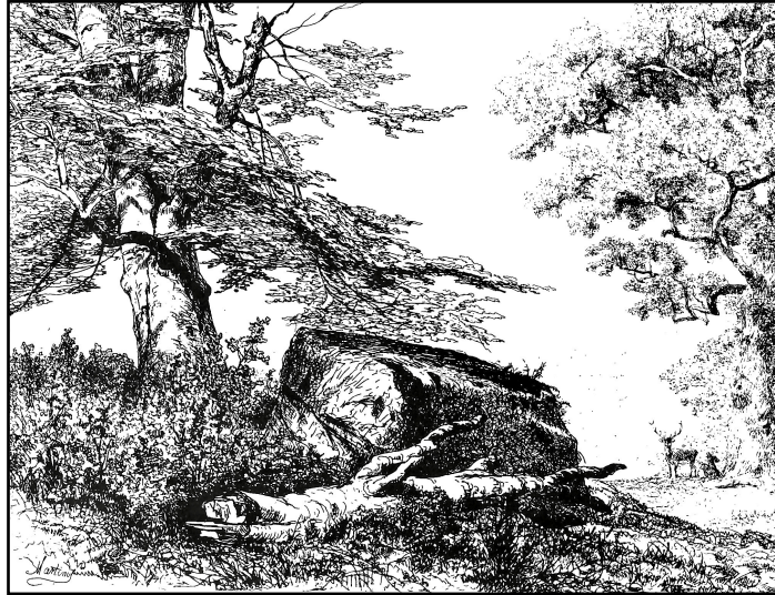
Le futur Deiwelselter vu par Martinus Antonius KUYTENBROUWER (*1821, +1897), artiste-peintre auprès de la cour de Napoléon III, vers le milieu du 19e siècle. [Dessin: Martinus Antonius KUYTENBROUWER; publication Jos. HERR_1986; scan: bp_2023]