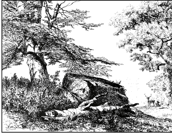
Le futur Deiwelselter vu par Martinus Antonius KUYTENBROUWER (*1821, +1897), artiste-peintre auprès de la cour de Napoléon III, vers le milieu du 19e siècle. [Dessin: Martinus Antonius KUYTENBROUWER; publication Jos. HERR_1986; scan: bp_2023]