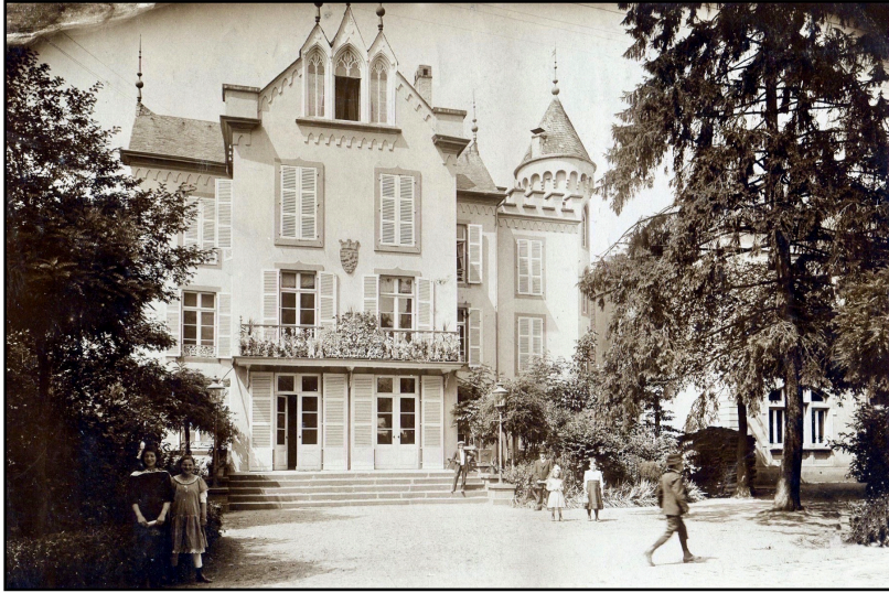
Hôtel de Ville de 1889 à 1959, le Château WIRTGEN avec ses annexes, porte en plein centre de sa façade principale le bas-relief du sculpteur diekirchois Michel DEUTSCH: le blason de la Ville de Diekirch, timbré d'une muraille à trois tours. [Photographie: NN_>1912; Bas-relief en 2020 .]