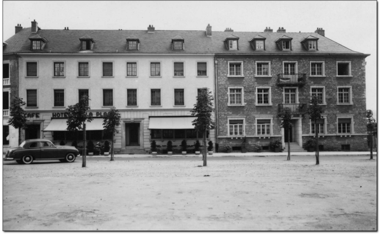
Le Café - Hôtel de la Place sur la Kluuster, à gauche, avant la Deuxième Guerre mondiale et, à droite, après la Deuxième Guerre mondiale. [Photographies: nbi; arrangement et légende: bp_2025]