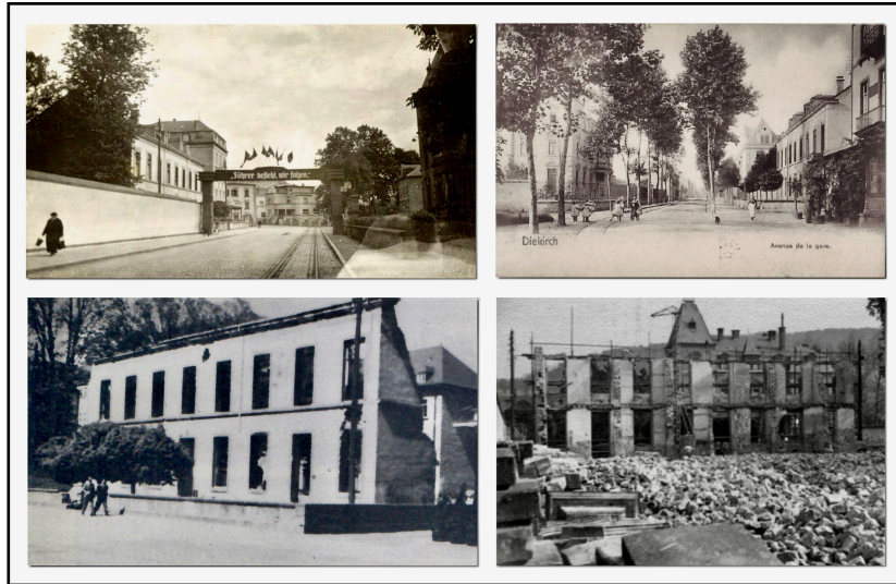
Le poste de gendarmerie sur l'avenue de la Gare à Diekirch au fil du temps. En haut à gauche, pendant l'occupation allemande 1940-1945, vue centripète: Bâtiment à deux niveaux à hauteur du portique et devant l'Hôtel Maison Rouge, bâtiment à trois niveaux. En haut à droite, 1909, vue centrifuge: Hôtel Beau-Site à gauche en face de l'Hôtel Maison Rouge à droite, suivi du poste de gendarmerie et du bâtiment de l'actuel Lycée classique de Diekirch. En bas à gauche, après l'offensive de VON RUNDSTEDT, 1945: Seule la façade sud du bâtiment de la gendarmerie est préservée. En bas à droite, après l'offensive de VON RUNDSTEDT, 1945: Vue arrière de la façade sud située devant l'Hôtel Beau-Site, transformé en Hôtel de Ville en 1959.