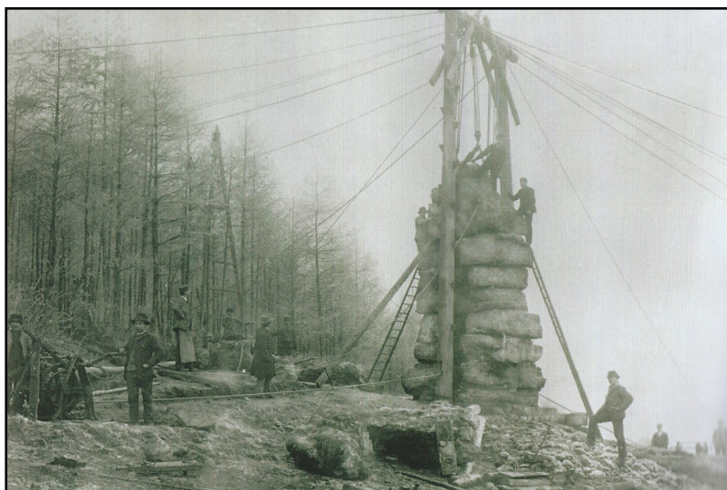
Deiwelselter, travaux de (re-)construction de 1892.