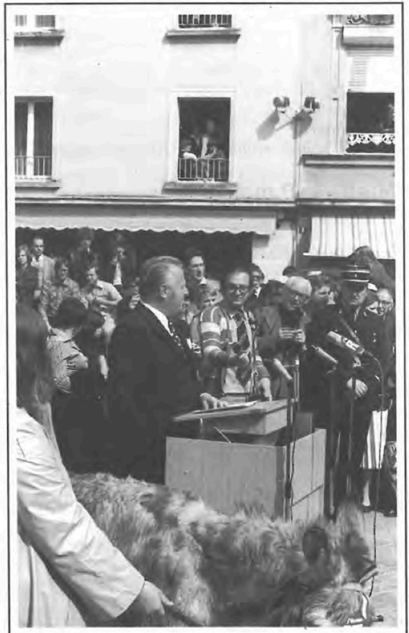
et du Ministre de l'Intérieur