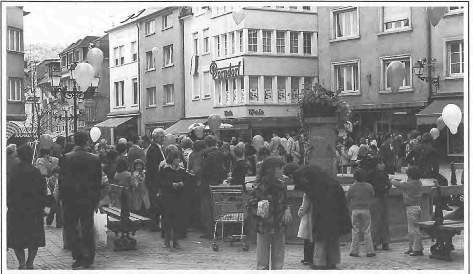
Les enfants lâchent des ballons.