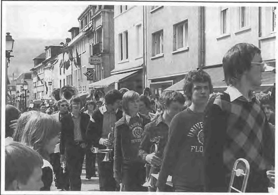
La " Fanfare du Lycée classique"

14.00 - 16.00 heures Écoles préscolaires: chants, danses Écoles primaires: quiz, jeux