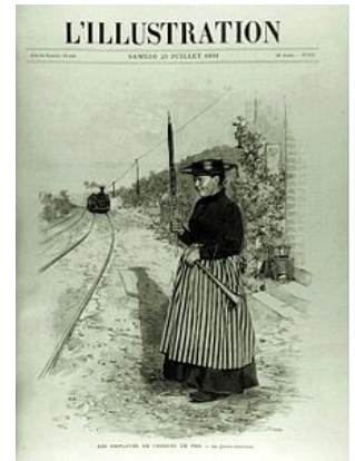
La garde-barrière, publiée le 25 juillet 1891.

Au début des années 1930, le journal, en pleine prospérité, est à l'étroit dans ses locaux de la rue Saint-Georges. Il acquiert en 1931, 30 hectares de terrains maraîchers, à Bobigny , sur le site de « la Vache à l'aise ». Un bâtiment de briques rouges et de béton, de 141 mètres de long et 90 mètres de large, surmonté d'une tour de 64 mètres de hauteur, y est construit afin d'accueillir l'une des plus grandes et des plus modernes imprimeries d'Europe. Les travaux s'achèvent le 15 décembre 1932 et l'inauguration a lieu le 30 juin 1933.