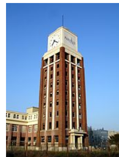
La tour de L'Illustration à Bobigny.

La fabrication de l'hebdomadaire exploite à cette époque deux techniques d'impression très luxueuses : l'héliogravure et l'offset. Cette dernière fait de L'Illustration un périodique original dans la presse écrite puisque ce procédé ne se généralise qu'après la Seconde Guerre mondiale . En 1933, L'Illustration possède à Bobigny sept machines offset Roland dont trois modèles en deux couleurs. De nombreux tirages en couleurs agrémentent les articles chaque semaine, mais c'est surtout le numéro de Noël qui incarne le mieux le nom de l'hebdomadaire. Véritable feu d'artifice de couleurs, ce numéro demandait un surcroît de travail de plusieurs mois à l'ensemble du personnel. L'historien Jean-Noël Marchandiau 18 signale notamment le témoignage d'un célèbre éditeur américain avouant l'incapacité de ses imprimeurs à égaler les prouesses de l'équipe des imprimeurs de Bobigny. En 1930, ce numéro de 35 pages, entièrement en couleurs, est vendu 35 francs alors que son prix de revient est bien supérieur.