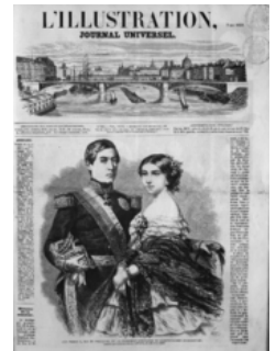
Une de l'édition du 8 mai 1858 : Don Pedro II [sic], roi du Portugal, et son épouse née princesse de Hohenzollern.